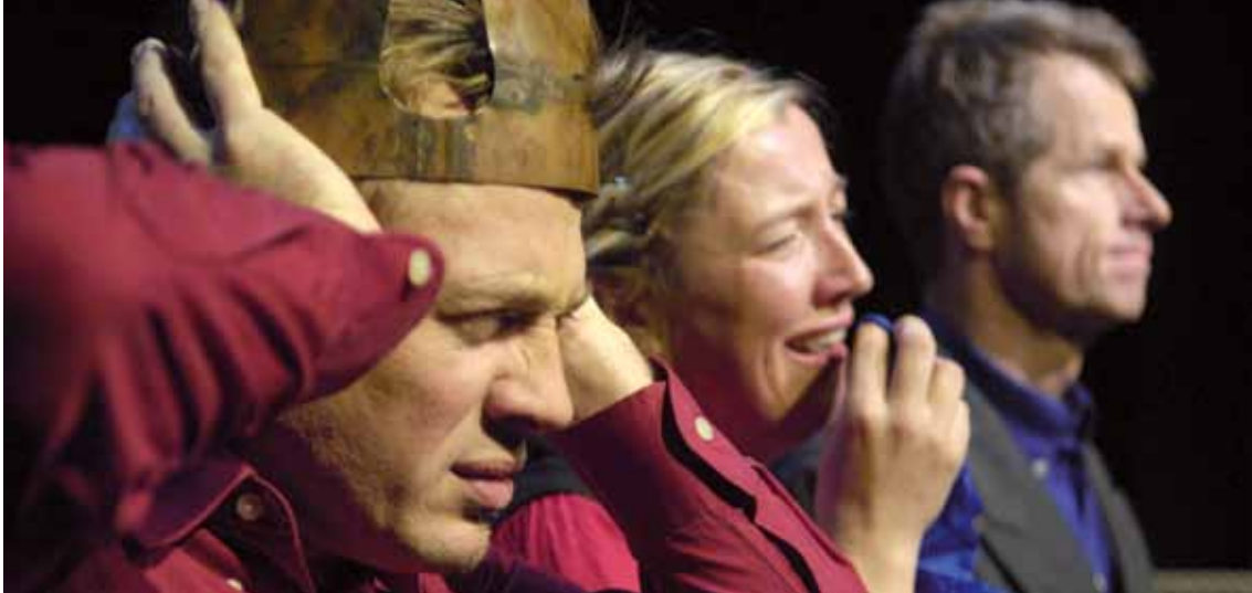
Heinrich der Fünfte