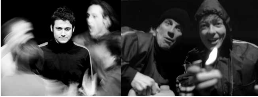
Nennen wir ihn Anna