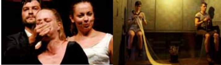
Storia di una famiglia