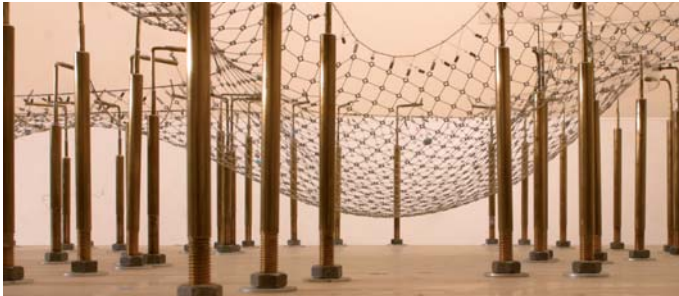
Frei Otto mit Carlfried Mutschler, Multihalle Mannheim, 1973