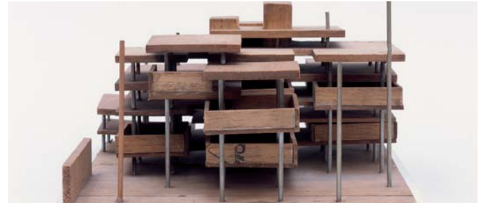
Oswald Mathias Ungers, Kunsthalle Düsseldorf, 1960