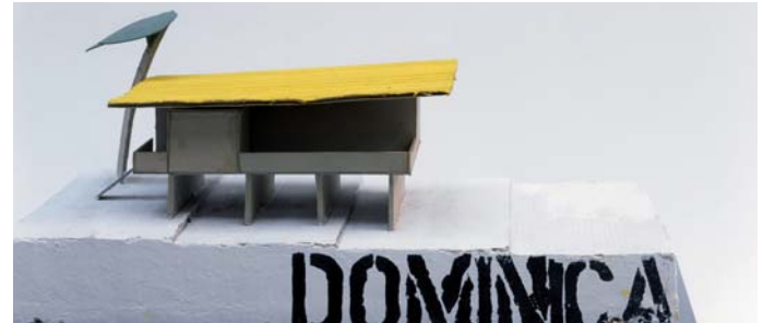
Peter Märkli, Haus eines Bananenpflanzers, 1991