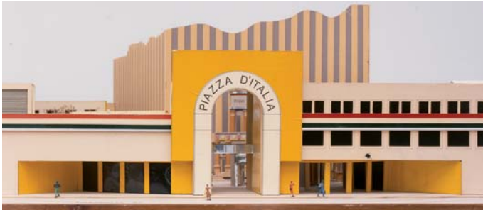
Charles Moore, Piazza d'Italia, New Orleans, 1977\78